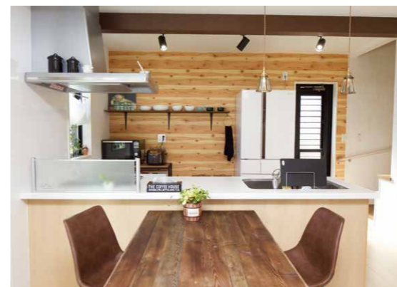
キッチンに余計な収納は作らずシンプルに。色合い、梁、照明は奥様の「夢ノート」通り!