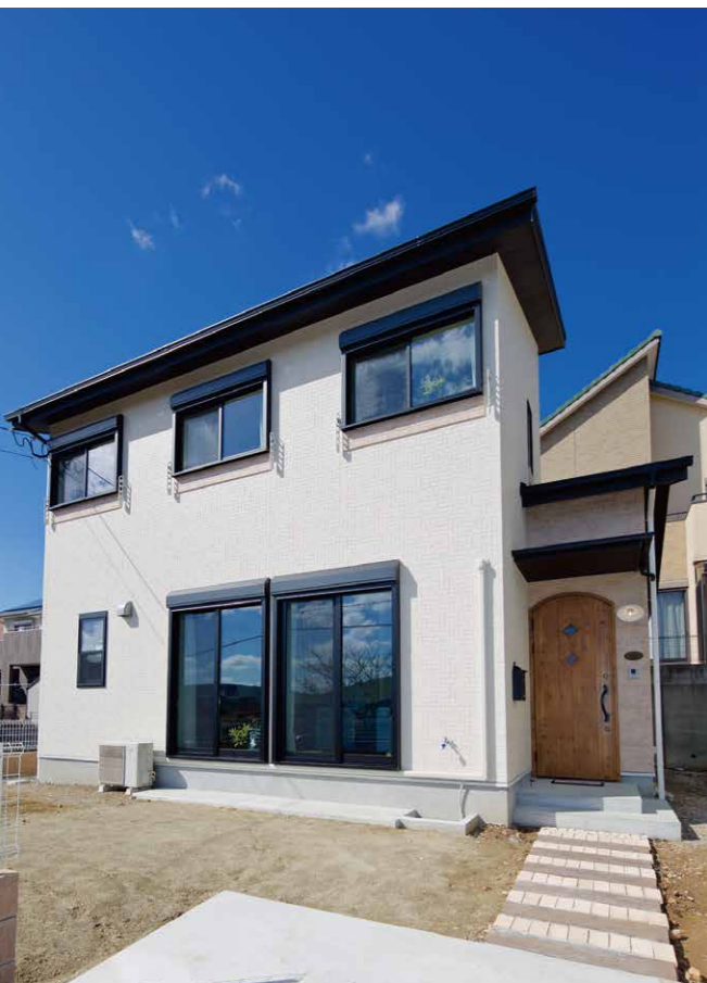
今は子どもたちの遊び場となっている庭。いずれ家庭菜園をはじめる予定